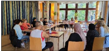
© Jala El Jazairi / ZAH

Am 14.09. fand eine Infoveranstaltung für Migranten aus ostasiatischen Ländern in Zusammenarbeit zwischen der Zentralen Anlaufstelle Hospiz und GePGemi statt. Die Teilnehmenden waren Multiplikatoren aus ostasiatischen Kulturgruppen. Empfehlung aus dem Austausch: zukünftig Übersetzungen in Sprachen wie Thailändisch oder Koreanisch zu erstellen. Bisher gibt es viele Fachinformationen nur auf Vietnamesisch.