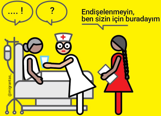
Dil aracılık hizmetleri